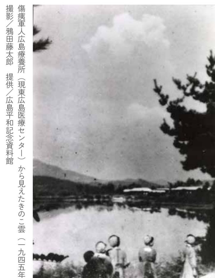
傷痍軍人広島療養所（現東広島医療センター）から見たときの雲（一九四五年）