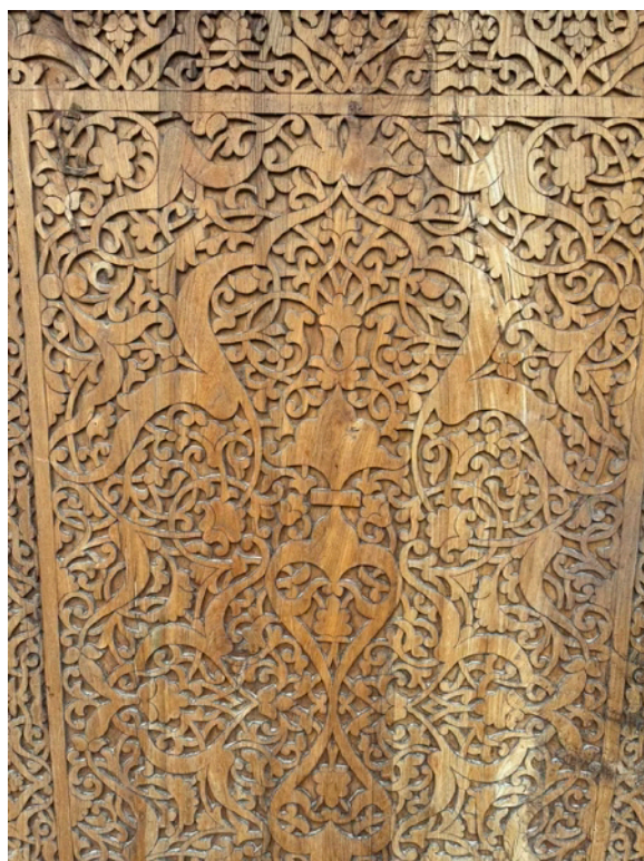
「ウズベキスタンのモスクの装飾」